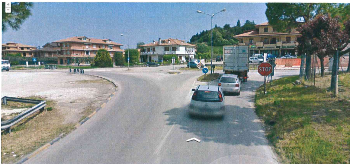
Figura 1 – Documentazione fotografica. Ripresa fotografica dalla S.P. n. 147 – Vesciò – Pescià, in direzione S.P. n. 60 – Montonese.