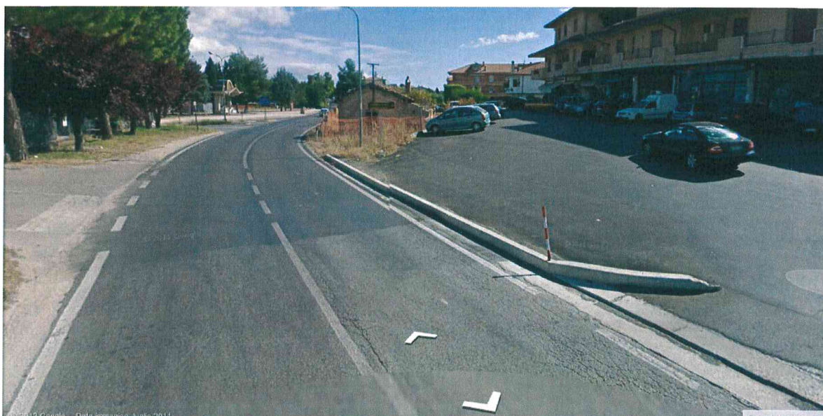
Figura 2 – Documentazione fotografica. Ripresa fotografica dalla S.P. n. 60 – Montonese, proveniendo da Grottazzolina in direzione Fermo.