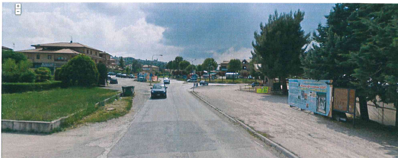
Figura 3 – Documentazione fotografica. Ripresa fotografica dalla S.P. n. 60 – Montonese, proveniando da Fermo in direzione Grottazzolina.