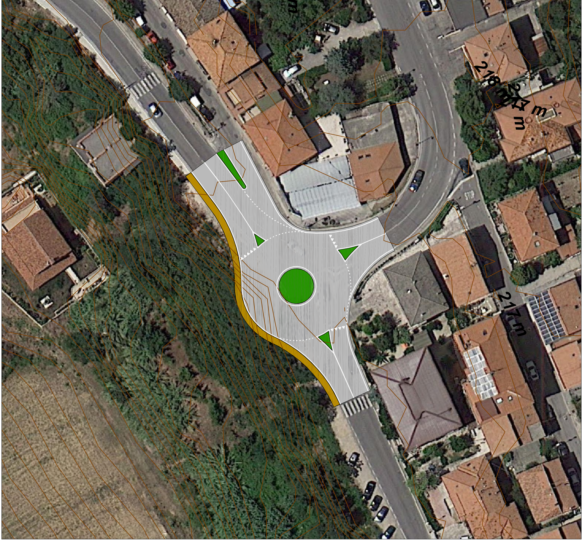
PLANIMETRIA STATO MODIFICATO (scala 1:500)