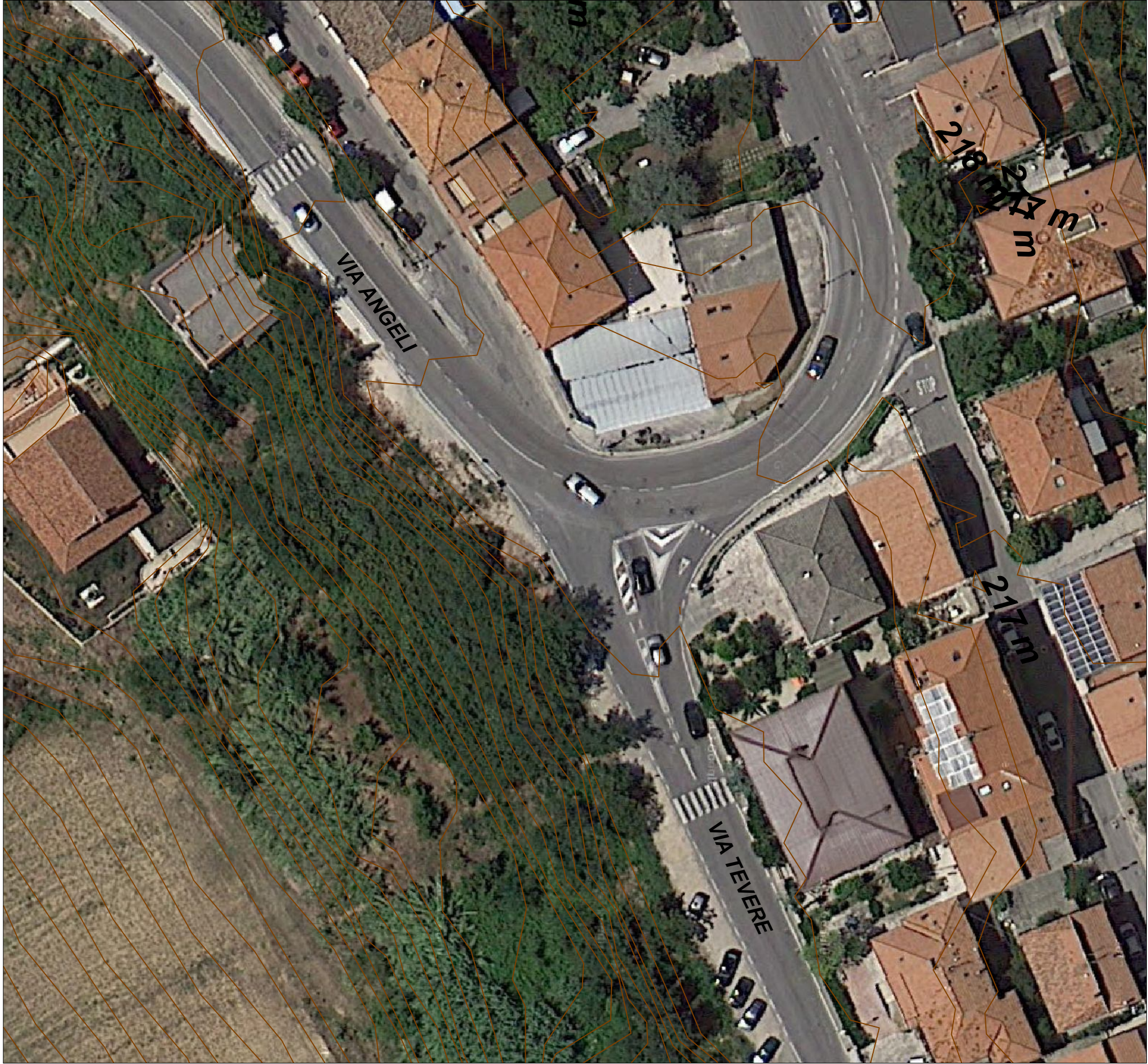
PLANIMETRIA STATO ATTUALE (scala 1:500)