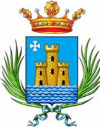
TAVOLA: 2 COMMITTENTE: Comune di Acquaviva Picena Via San Rocco, 9 63075 Acquaviva Picena ( AP ) Tel. 0735 764005 - Fax 0735 764643