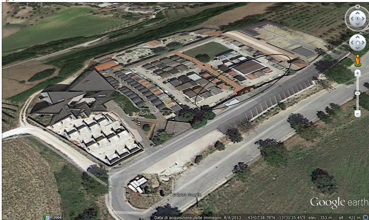
Vista generale del Cimitero Capoluogo