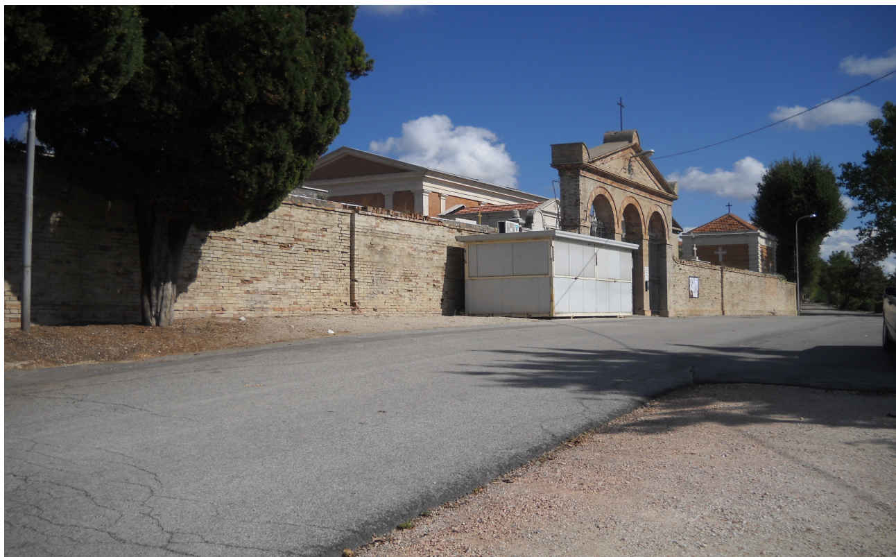
Vista della zona dell'intervento