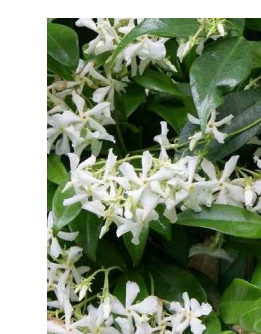
Falso Gelsomino ( Rhynchospermum Jasmonoides )