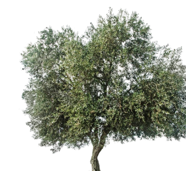
Ulivo ( Olea europaea )