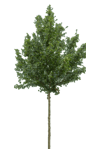
Acero Campestre ( Acer Campetre L.)