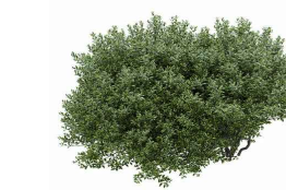
Ligustro ( Ligustrum vulgare L.)