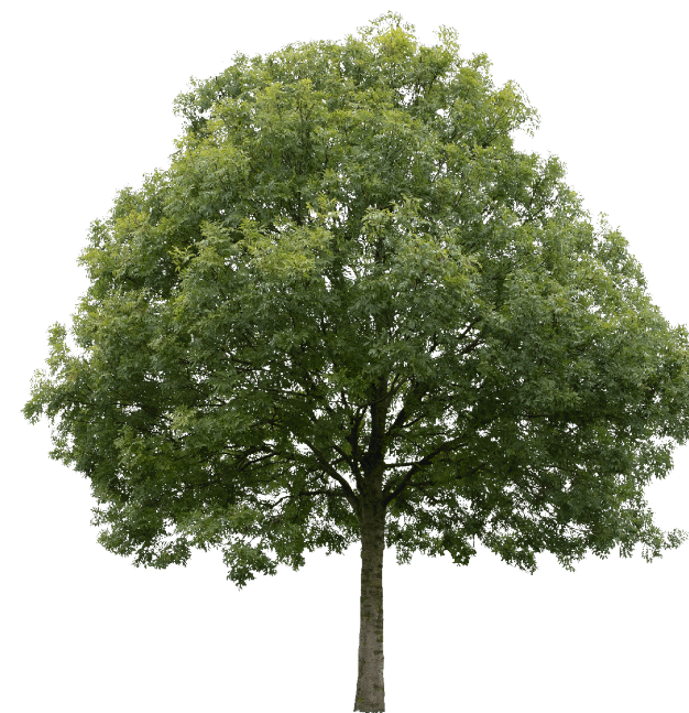
Orniello ( Fraxinus ornus L.)