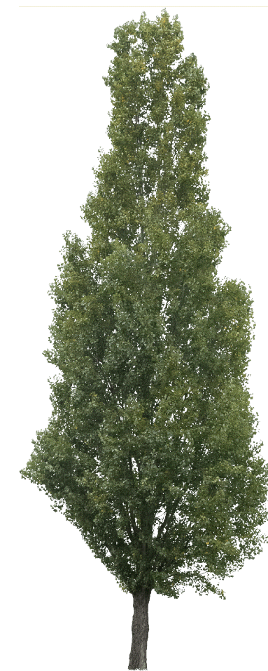
Pioppo nero ( Populus nigra L.)